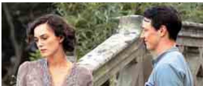
Η Κίρα Νάιπλι και ο Τζέιμς ΜακΑβόι στην κινηματογραφική μεταφορά της «Εξιλέωσης»

«Κτηνώδης δύναμη», συναρπαστικό θέαμα. Η χορευτική ομάδα De la Guarda, γνωστή και στο αθηναϊκό κοινό από τα εντυπωσιακά χορευτικά ηχοθεάματα στο πρώην ανατολικό αεροδρόμιο, παρουσίασε την «Fuerza Bruta: Look Up», ή αλλιώς «Κτηνώδης δύναμη: κοιτάξτε ψηλά» – ένα ακόμη ασυνήθιστο σόου – στο Μπουένος Άιρες. Πάνω σε μία καλά τεντωμένη πλαστική διάφανη επιφάνεια πλημμυρισμένη από νερό, η οποία κρεμόταν μερικές δεκάδες εκατοστά πάνω από τα κεφάλια των θεατών, οι χορευτές – μέλη της ομάδας εντυπωσίασαν με ένα ηχοθέαμα που συνδυάζει πρωτότυπες χορογραφίες, πλαστικότητα κινήσεων, ερωτική αύρα και... δροσερές σταγόνες. Με τους κατάλληλους – υποβλητικούς – φωτισμούς εναρμονισμένους με ελέκτρο ποπ συνθέσεις, ο θεατής είχε την ψευδαίσθηση ότι οι χορευτές περπατούσαν ή κολυμπούσαν στον αέρα. Φλόγες, νερό, αέρας, καπνοί και άλλα οπτικά εφέ δημιούργησαν μια φαντασμαγορία. Οι θεατές δεν είχαν παρά να σηκώσουν τα χέρια και να αξίζουν τη διάφανη μεμβράνη που τους χώριζε από τους χορευτές και τους κρατούσε στεγνούς.