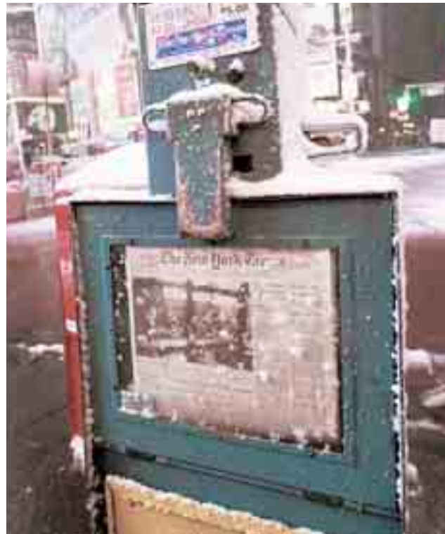
Να «παγώσει» τις πωλήσεις της «New York Times» και να κερδίσει μεγαλύτερο μερίδιο στη διαφημιστική πίττα σχεδιάζει ο ιδιοκτήτης της «Wall Street Journal» Ρούπερτ Μέρντοχ (κάτω)

κομμάτι διαφημίσεων – κυρίως από την αγορά των ειδών πολυτελείας και από τα μεγάλα κηματομεσικά γραφεία – που πα-