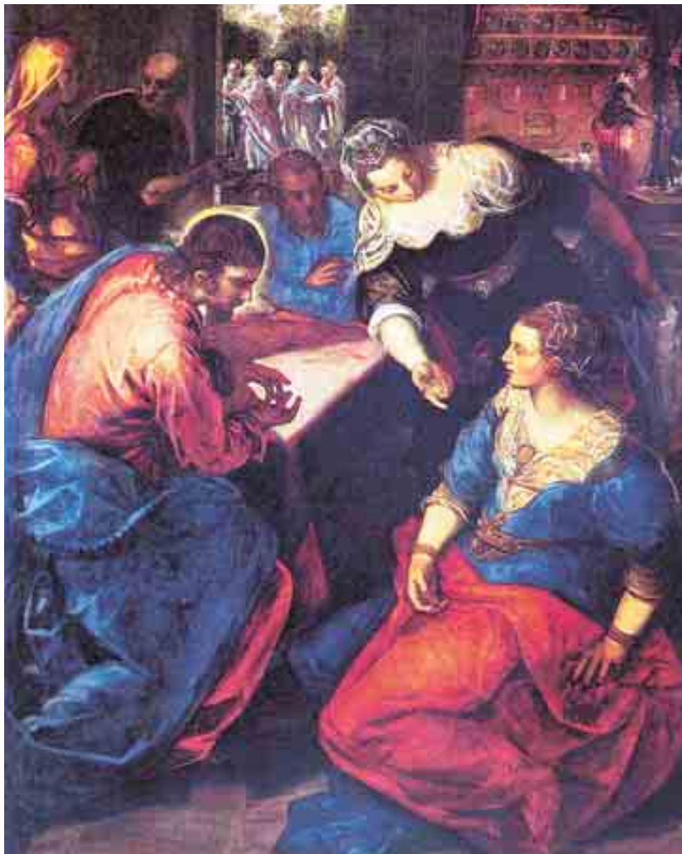
«Ο Ιησούς στο σπίτι της Μάρθας και της Μαρίας» (1570-75). Έργο του Τιντορέτο σε καμβά, από την Πινακοθήκη του Μονάχου

Προσπαθώντας να ανιχνεύσω και την επιλογή από τον Λουκά μιας λέξης απροσδόκητης στα χείλη του Χριστού, μιας τελείως άγνωστης λέξης σε όλο το λεξιλογικό φάσμα της Αγίας Γραφής, και της Παλαιάς και της Καινής, διαπίστωσα αναδιδώντας τις πηγές πως και το ουσιαστικό τύρβη αλλά και κυρίως ο τεχνικός όρος τυρβασία έχουν διονυσιακή καταγωγή. Ο Διόνυσος είχε ως προ-