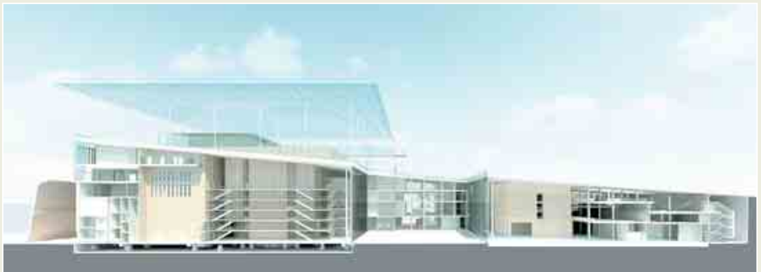
Διατομή της μακέτας του Ρέντζο Πιάνο για το Κέντρο Πολιτισμού Ίδρυμα Σταύρος Νιάρχος στο Φαληρικό Δέλτα, το οποίο ο αρχιτέκτονας χαρακτηρίζει ως «δημόσιο τόπο συνάντησης» και ως κτίριο που αξιοποιεί το «τόσο ιδιαίτερο φως της Αθήνας»