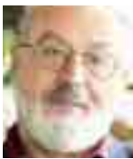
Του Κώστα Γεωργουσόπουλου

Θα φανώ σήμερα ίσως βλάσφημος, αλλά πάντα με είλκυε κάθε είδους πρόκληση που εκκινούσε από το βάθος της γλωσσικής μας παράδοσης και από την πολυσημία των εννοιών μέσα στην περιπέτεια της γλωσσικής διαχρονίας