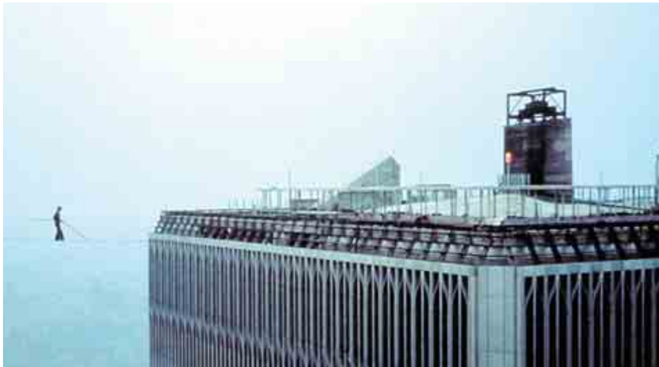
Θεέ μου, τι άθλος! Ο Φιλίπ Πετί και το κενό

Ο Δημήτρης Δανίκας προτείνει και αντιπροτείνει ddanikas@dolnet.gr