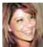
Γράφει η Νατάσα Μπαστέα natadolnet.gr

Μεγαλύτερο βαθμό ανταπόκρισης δείχνουν οι Ευρωπαίοι καταναλωτές στις online διαφημίσεις σε σύγκριση με τους Αμερικανούς καταναλωτές. Σύμφωνα με στοιχεία της εταιρείας Comscore, ο ρυθμός των επισκέψεων σε ιστοσελίδες μετά την έκθεση σε διαδικτυακές διαφημίσεις είναι κατά 49% υψηλότερος από τον αντίστοιχο στις ΗΠΑ. Οι χρήστες του Ίντερνετ που εκτίθενται σε διαφημιστικές καμπάνιες επισκέπτονται σε ποσοστό 72% την ιστοσελίδα ενός διαφημιζόμενου, σε σύγκριση με εκείνους που δεν βλέπουν διαφημίσεις στις ιστοσελίδες που επισκέπτονται.