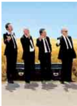
The four Καμπαλέρος

Να το δω; Breathtaking. Ακόμα είσαι εδώ;