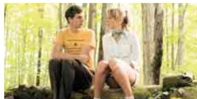
Όταν ο Νίκι το ακούμπησε στη Σίνι

Σίνι please. Άφησέ με να στο ακουμπήσω. Έστω για μια μικρή στιγμή. I beg you! Κάπως έτσι, ο ευγενέστατος, ευπρεπής, νοστιμούλης και χαμηλόφωνος Νίκι, μέσα στην απελπισία του αποφάσισε να μεταμορφωθεί. Γιατί η μπεμπέκα θέλει σεξ με αρσενικό κτήνος για να χαρεί! «Youth in revolt». Μεθερμηνευόμενο στον ολόσωστο ελληνικό τίτλο «Νιάτα σε έξαψη». Μια μουρλή, ενίοτε θεόμουρλη, αμερικανική κομεντί του Μιγκέλ Αρτέτα που βαδίζει στα χνάρια του «Hangover». Με πρωταγωνιστές τον Μάικλ Σέρα και τη μικρή Λολίτα Πόρσια Ντάμπλντνι. Ακολουθούμενοι από