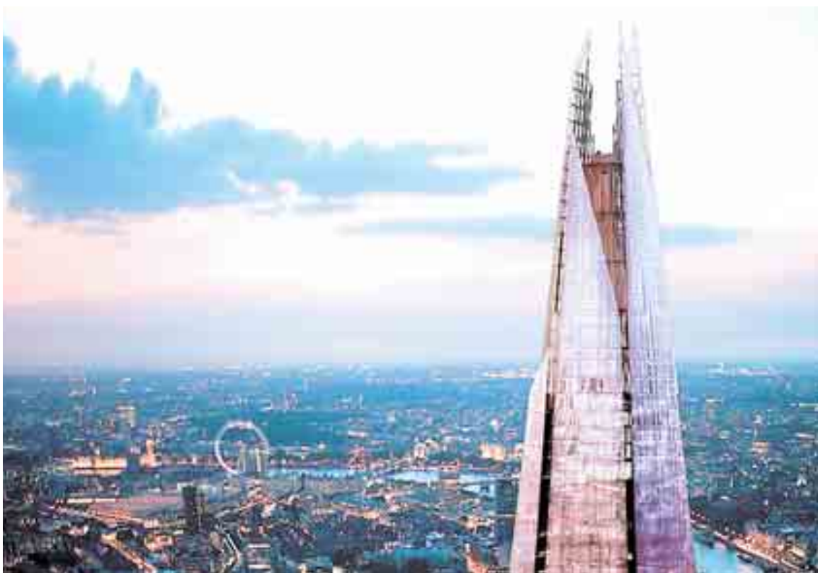
Έναν γυάλινο πύργο που «θα αιωρείται σαν τον Βράχο του Ρενέ Μαγκρίτ», όπως λέει και θα τροφοδοτείται με ενέργεια σχεδόν αποκλειστικά από τις φωτοβολταϊκές κυψέλες στα 3.350 τ.μ. της εντυπωσιακής επικλινούς –κωνικής– στέγης του σχεδίασε, με προοπτική να τον ολοκληρώσει το 2012, ο Πιάνο για το Λονδίνο, σε έκταση 55 στρεμμάτων μπροστά στο σταθμό London Bridge του Μετρό

κατοικήσιμο χώρο (living room), με μεγάλα ανοίγματα προς τη θάλασσα και προς την πόλη. Θα προσπαθήσουμε να εκμεταλλευτούμε το φως που είναι τόσο ιδιαίτερο στην Αθήνα για να δημιουργήσουμε ένα κτίριο ελαφρύ και διάφανο που δεν θα επιβαρύνει το τοπίο», λέει για το έργο που χρηματοδοτεί ως γνωστόν με 550 εκατ. ευρώ το Ίδρυμα Σταύρος Νιάρχος.